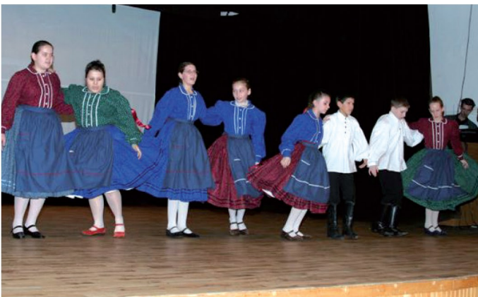
A Tücsökmadár Néptáncgyűttes műsorában szerepelt: Bökönyi táncok, Sárközi karikázó, Gergelyjárás, Sárközi lassú csárdás