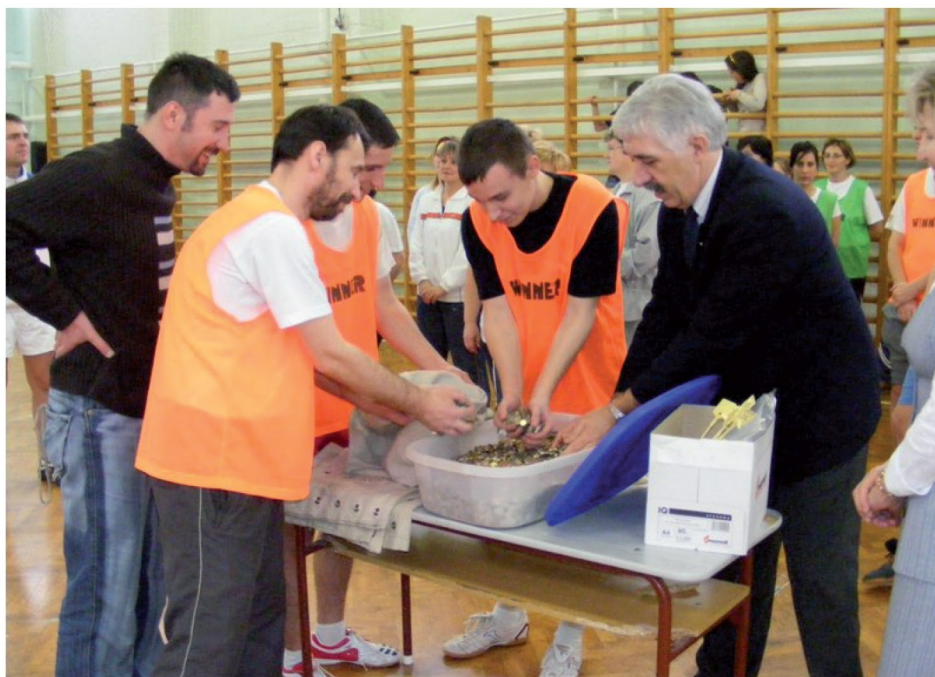
Számolják az összegyűjt 1 és 2 forintosokat

A zárónapon az 1 és 2 forintosok átadására