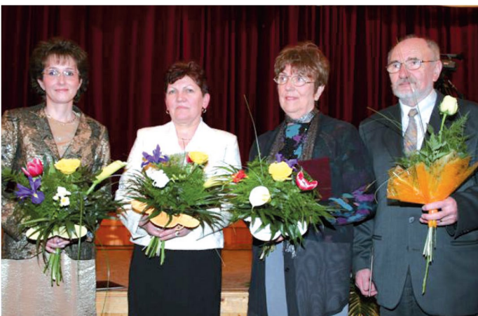
Az ünnepségen a Kossuth Lajos Általános Iskola volt igazgatóit is köszöntötték