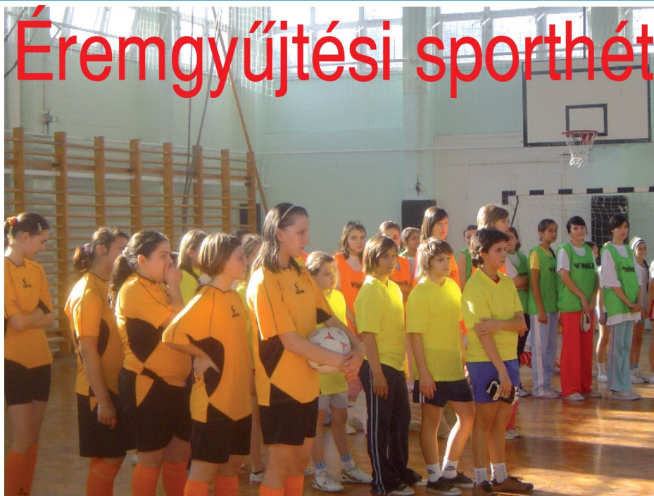
Fiú- és lánycsapatok is jelentkeztek a sportprogramokra

került sor az ÉRMEGYŰJTÉSI GÁLA keretein belül, ahol a tanárnők az anyukákkal, a tanárok a volt diákokkal futballoztak.