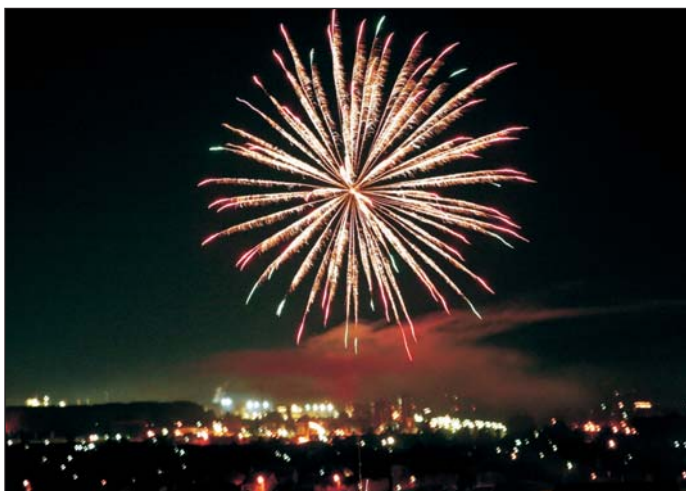
Az ünnepsorozat színpompás tűzijátékkal ért véget