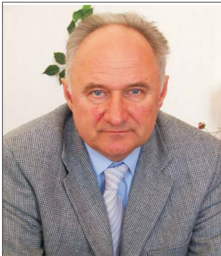
A 2. számú választókörzet képviselője

vül nagy hangsúlyt fektettünk a pályázati lehetőségekre.