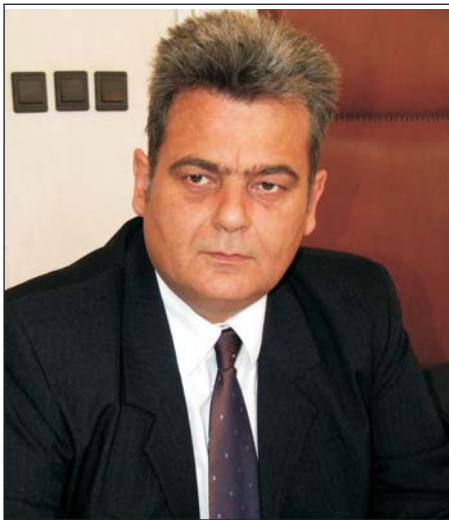
Az 1. számú választóköri képviselője

1. Ahhoz, hogy egy képviselő-testület jól végezhesse a munkáját legalább négy feltételnek meg kell lennie.