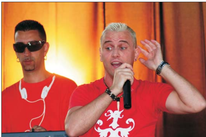
Nagy sikert aratott a Kozmix együttes

Ezt követően a Theatrum Hungaricum Színház ünnepi műsora következett Szent István király emlékezete címmel. Előadásukat követően fokozatosan