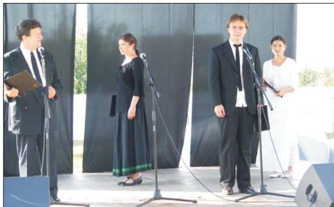
A Theatrum Hungaricum társulata a városi színpadon