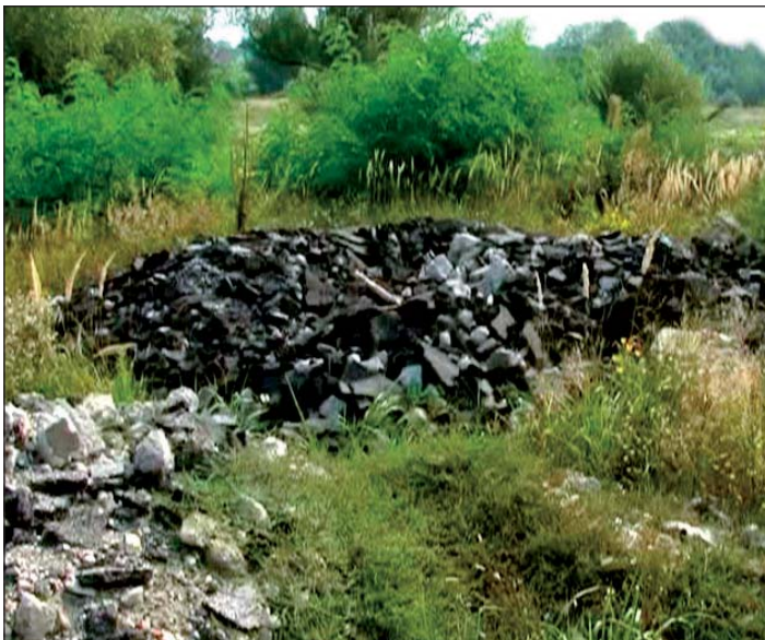
Megtisztítják az egykori üvegyár melletti területet