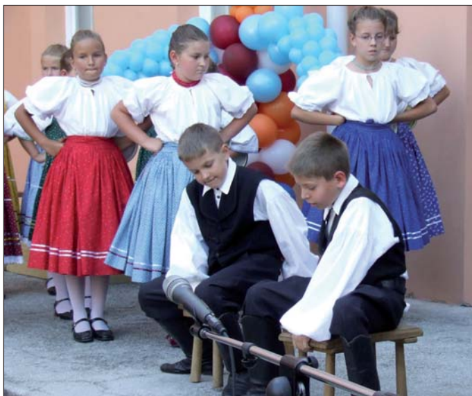
... és táncsal köszöntötték az ünnepség résztvevőit