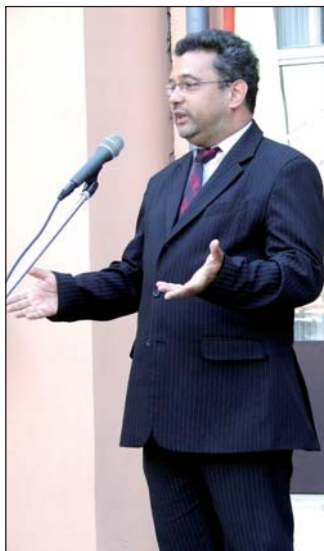
Arató Gergely államtitkár

- Az a fontos, hogy többfajta többletjelölést ismerjünk el. Valóban létezik olyan javaslat, amely a pályakezdőknek juttatna többet, elsősorban azért, hogy a tehetséges fiatalok a pedagógusi pályát válasszák, hiszen 20-30 év múlva is nagy szükség lesz jó minőségű szakemberekre. Emellett (többek között) emeljük az intézményvezetői pótlékot, többletforrásokat biztosítunk azoknak a pedagógusoknak, akik halmozottan hátrányos helyzetű gyerekekkel foglalkoznak, sőt szeretnénk emelni a teljesítménymotivációs alapot is, tehát azt a forrást, amit a jól dolgozó, jó teljesítményt nyújtó kollégák kaphatnak meg. Alapvetően az az elvünk, hogy ne csak a pályán eltöltött idő, hanem az elvégzett munka minősége, valamint a helyi közösség által elismert teljesítmény is számítson a jövedelmeknél.