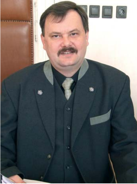
A 6-os választókerzet képviselője

mindennél fontosabb, mert könnyebben találunk befektetőket.