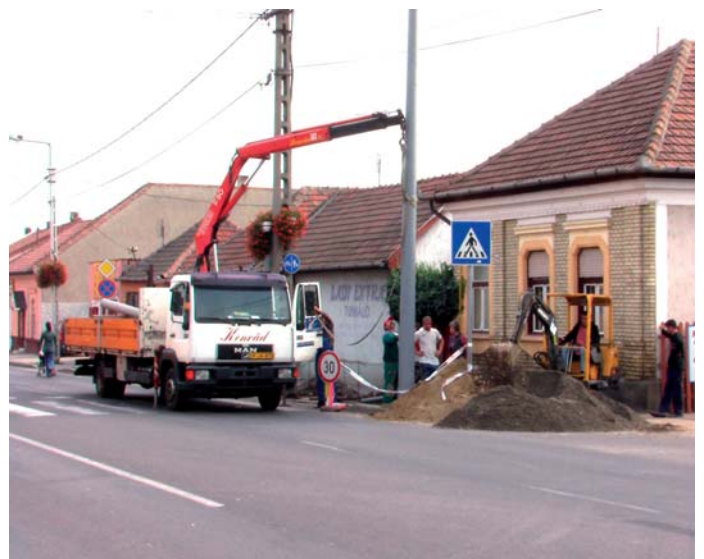
Rövidesen egy forgalomirányító jelzőlámpát helyeznek üzembe