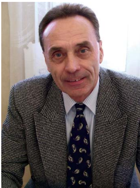
Az 5. számú választóközvet képviselője

1. A képviselő-testület munkájának megítélése elsősorban a város polgárainak a feladata. Ahhoz, hogy a testület jól és hatékonyan tudja végezni a munkáját, feltétlenül szükséges a jól működő apparátus jelenléte. Néhány gondolatban összefoglalom, hogyan látom az eltelt időszakot a megvalósult feladatok és az elvégzett munka tükrében.