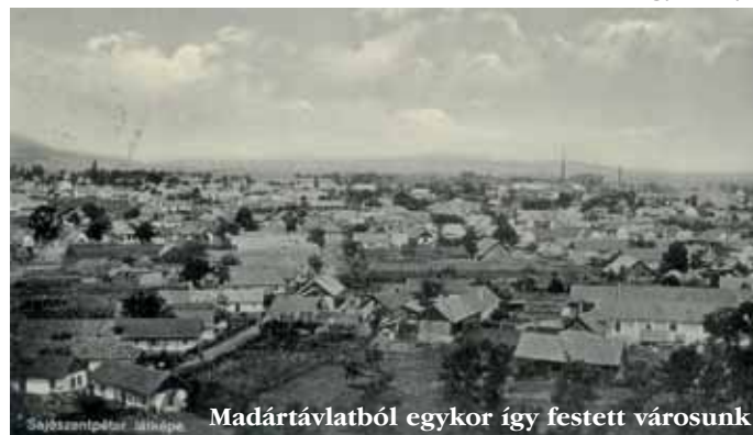
Madártávlatból egykor így festett városunk

- Most különleges szempontok alapján válogatunk: egyrészt szeretnénk azok segítségét megköszönni, akik a családi albumukból a rendelkezésünkre bocsátottak egy-egy érdekesebb fotót, így ezek a képek biztosan láthatók majd az MSK galériájában. Másrészt valódi kuriózumokat is szeretnénk az érdeklődők elé tárni, igaz, egy háborús hasonlattal élve: nem szeretnénk minden puskaopt ellőni, hiszen a végső cél az, hogy a városfotókból a későbbiek során egy könyv