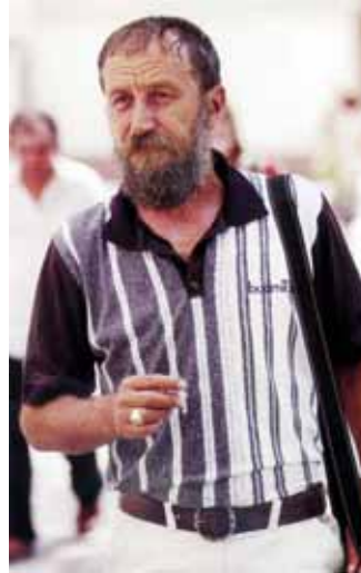
Örök hűség köti gyermekkori lakóhelyéhez

viselhette a festőművész rangot. A művészetből nem lehetett megélni, ám munkásságát látva Kazincbarcikán grafikusként alkalmazták a művészeti központban, majd hamarosan három kiállítóterem vezetésével bízták meg. A következő 40 évben a kortárs képzőművészek galériáit szervezte és rendezte a vegyészvárosban. Műtermébe sorra érkeztek a megrendelések, és ő nem volt az az alkotó, aki azokat visszautasította volna. Megtervezte és megrajzolta mintegy 50 tele-