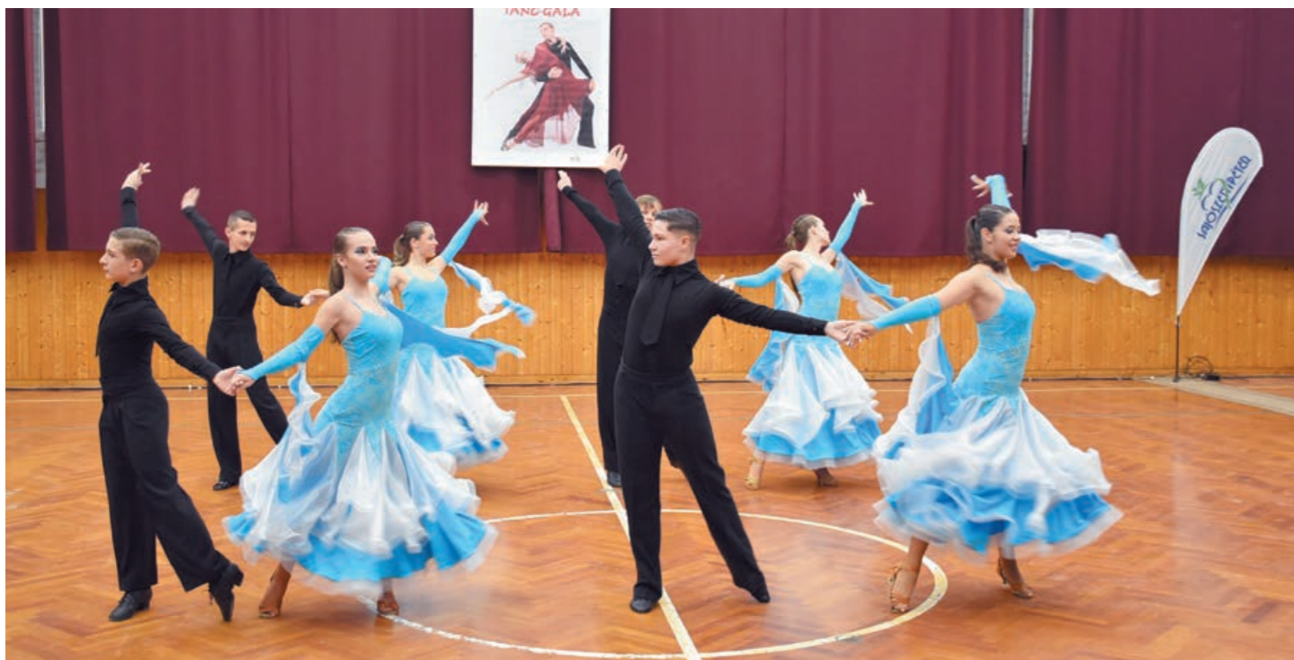
A Freedance 2008 TSE „A” csapatát tapasztaltabb, rutinos táncosok alkotják

Visszatérő vendége a táncgálának a Ködmön Társastánc SE Miskolcra, akik Simon Csaba standardmix- és bécsikerin-