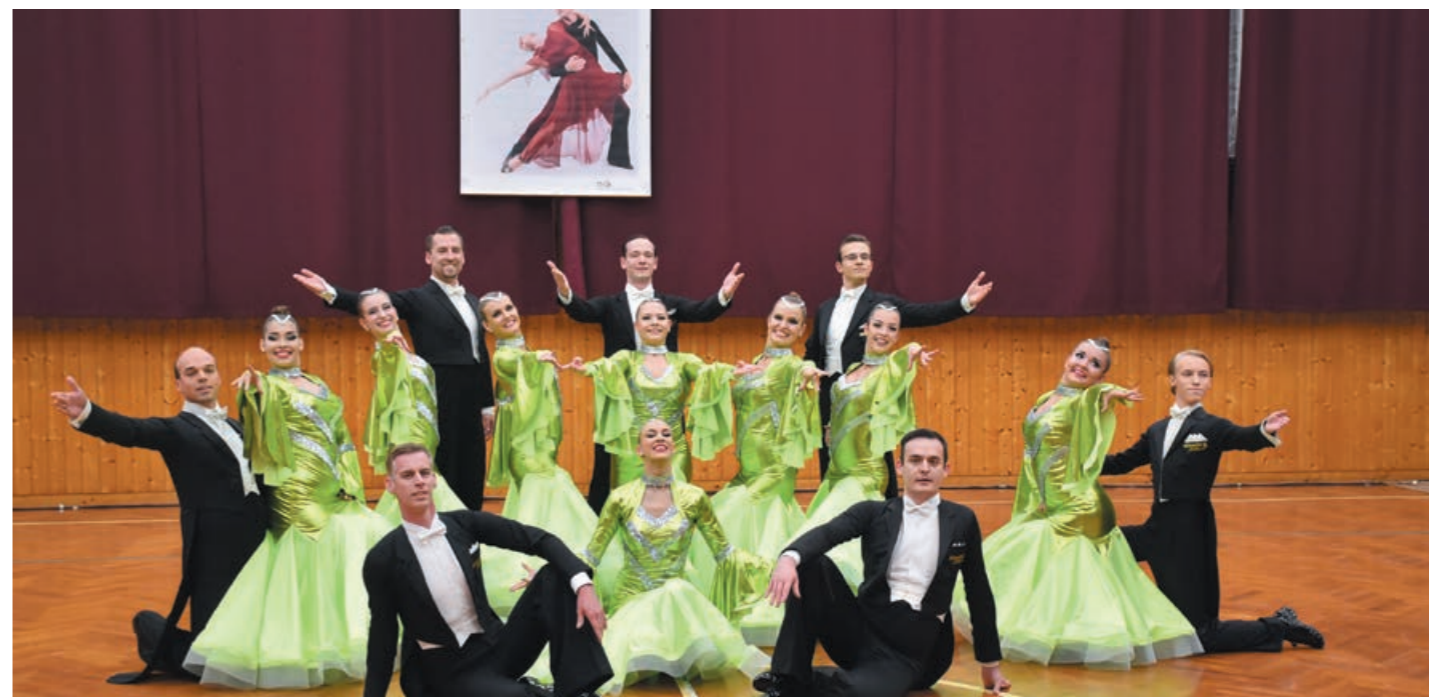
A Ködmön Társastánc SE tagjai ugyancsak minden évben vendégei a Formációs Táncgálának, hiszen a szomszédból, Miskolcra érkeznek