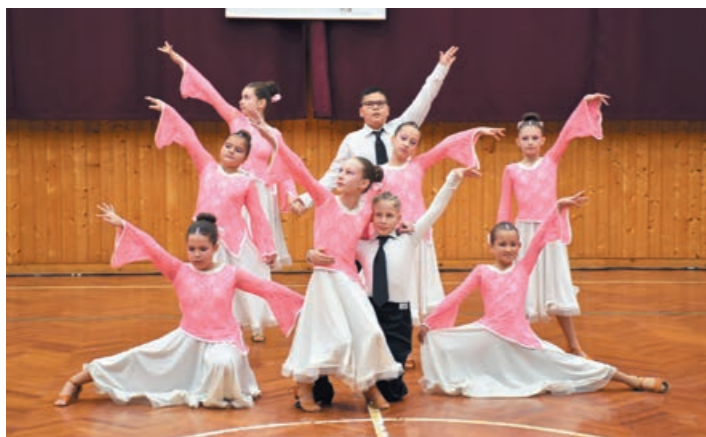
A táncparketten a Freedance 2008 TSE „B” csapata

A tánc megkönnyíti az érzelmek átélését és kifejezését, mindeközben kiegyensúlyozottságot, örömet és szabadságérzetet ad. Kifejezheti és elmélyítheti a szeretetet, a kapcsolatokat, az egybetartozást, de kifejezheti a harcot, a vetélkedést, a gyűlöletet és a küzdelemre készülődést is.