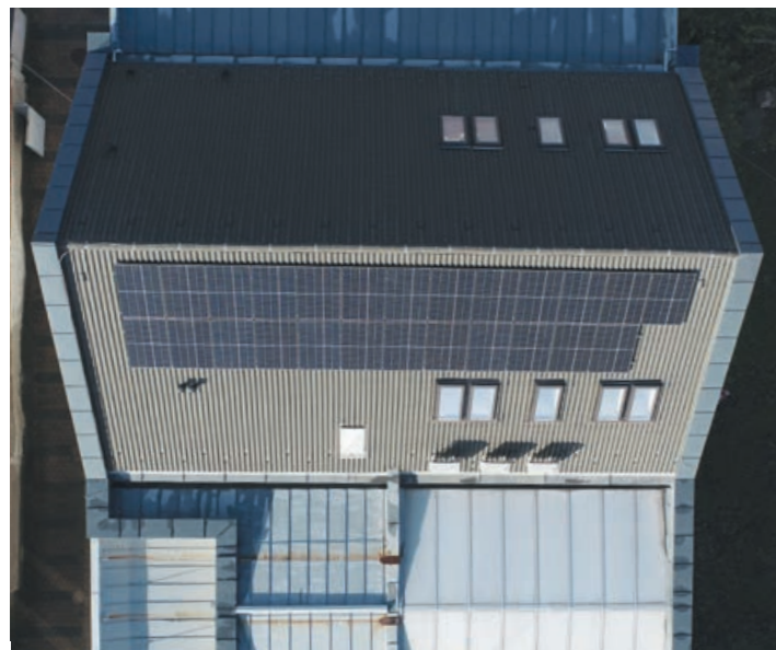
A Rendezvények Házában csak egy kapcsolót kell elfordítani a napelemes rendszer üzembe helyezéshez

Úgy tűnik, a következő fűtési szezonról már mi is hozzájárulunk a klímaterv legfontosabb stratégiai célkitűzéseihez, egyben ösztönözhetjük a lakosságot is az alacsony széndioxid-kibocsátású energiaforrások felhasználására, és csatlakozva a globális erőfeszítésekhez, mi is tehetünk valamit a bolygónk unokáink számára történő megmentése érdekében.