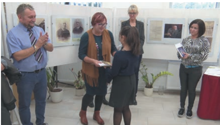
Díjátadás a Lévay József Könyvtárban a szavalóverseny végén