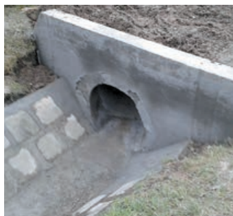
Az Attila utcában a kapubejárók alá nagyobb keresztmetszetű átvezetők kerülnek

Számítások alapján Magyarországon az évszázad közepére minden évszak legalább 1 °C fokkal, a nyár átlagosan akár 4 °C fokkal is melegebb lehet. A növekvő párolgás, a gyorsuló felhőképződés miatt több és intenzívebb szélsőséges időjárás-változásra számíthatunk. Legfontosabb feladatunk tehát alkalmazkodni a fenti szélsőségekhez. A vízgazdálkodásban elsődleges szerepet kell kapnia a táj (talaj, gyepek, erdők) vízmegtartó képességének, hiszen már nemcsak a hírekben láttuk, hanem saját bőrünkön is tapasztalhattuk, hogy a szinte semmiből lesújtó villámárvizeknél még