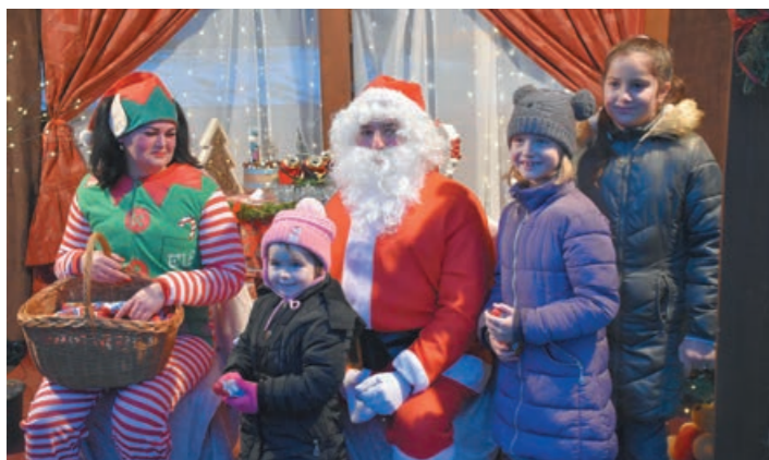
A legkedvesebb fotók az idén is a Mikulással és az ő manójával készültek

lás, pedig ha megvárta volna a december 6-ai Miklós-napot, akár rénszarvas vagy lovas szánon is elcsúszhatott volna a Generációk Kertjébe. Akkorra ugyanis jókora hótakaró leperte be városunkat, amire hosszú-hosszú évek óta nem volt példa. A rendezvény napján is fehér volt valamelyest a táj, de ezúttal nem a hócsatára és a szánkózásra koncentrált a fiatalabb korosztály, hanem inkább a számukra felkínált programokra. Ilyen volt a Karácsonyi pontyhorgászat, ahol