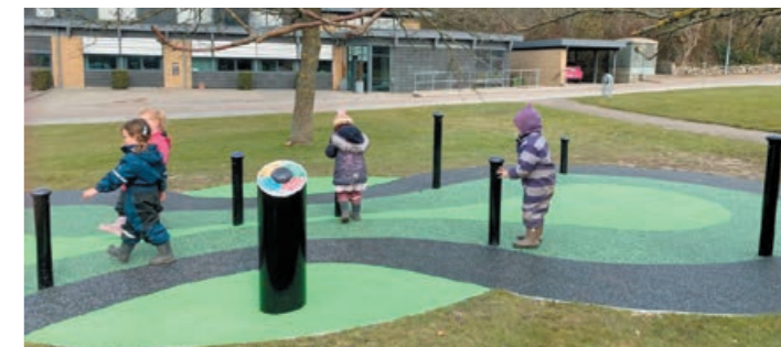
Az interaktív (okos)játszótér elemei alapjaiban másfajta kikapcsolódást kínálnak a gyerekeknek

A támogatás nagyobb részének segítségével a Harica-ligetben egy olyan sportolásra, aktív pihenésre, kikapcsolódásra szolgáló közösségi tér valósulhat meg, amely a Nyögő-patak menti sávban dupla fasoros, illetve ligetesen kiszélesedő fásítással teljessé teszi az összefüggő zöldfelület funkcionális egységét. A környezettudatosságot és