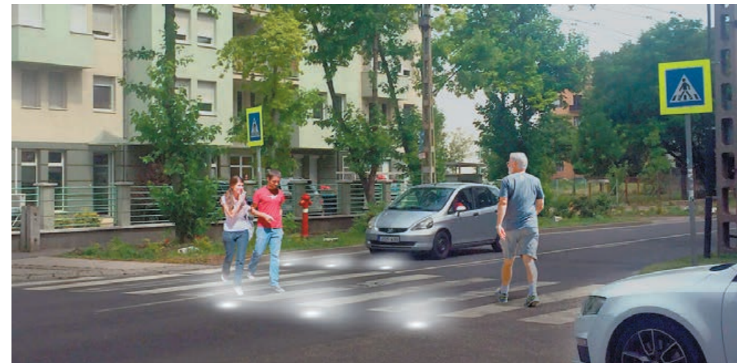
A Hunyadi Mátyás Tagiskola szomszédságában „okoszebrát” alakítanak ki

A Tárna utcával párhuzamos városrészi gyűjtőútként működő Baross Gábor utca a Nyögő-híd és a Vörösmarty utca közötti szakaszon új kopórteget kap. Az Erőmű utcának a Zsigmond király utca - Hazafias utca közötti szakaszára - a szükséges helyi kátyúzási munka elvégzése és kétoldali padkaépítés után - szintén teljes szélességben aszfaltkopórteget kerül. Az lbolyatelep felé vezető (és a helyi közlekedés egyik neuralgikus pontjának számító) Kőkény utcában a jelenlegi aszfaltburkolatú út, valamint a betonburkolatú folyóka és járda elbontásra kerül. Helyére útalapként egy cementkötésű teherhordó réteg (Ckt-beton), arra aszfaltkötő és -kopórteget kerül. A kétoldali padka kiépítésénél az út és a járda közötti elválasztáshoz (íves profilú) „K” szegély, az út másik oldalára süllyesztett szegély sor kerül. A Tárna utcai útszélesítés és a többi utcán tervezett padkaépítés a biztonságos kerékpáros közlekedés feltételeit is növeli azzal, hogy előzésnél a kerékpár mellett megfelelő oldaltávolságot lehet majd tartani.