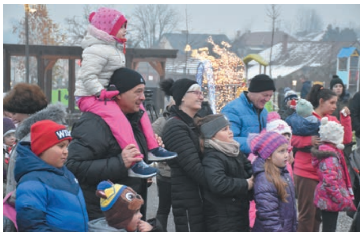
Nem csupán a gyerekek, de a felnőttek is örömmel nézték a Miskolci Csodamalom Bábszínház előadását

Hóval köszöntött be idén a december a gyerekek nagy-nagy öröme, így a Mikulás-napi rendezvény fehér hát-tér előtt zajlott. A Generációk Kertjébe szolt a Mikulás meghívója városunk lakóihoz, így aki találkozni szeretett volna a lappföldivel, kilátogatott a helyszínre.