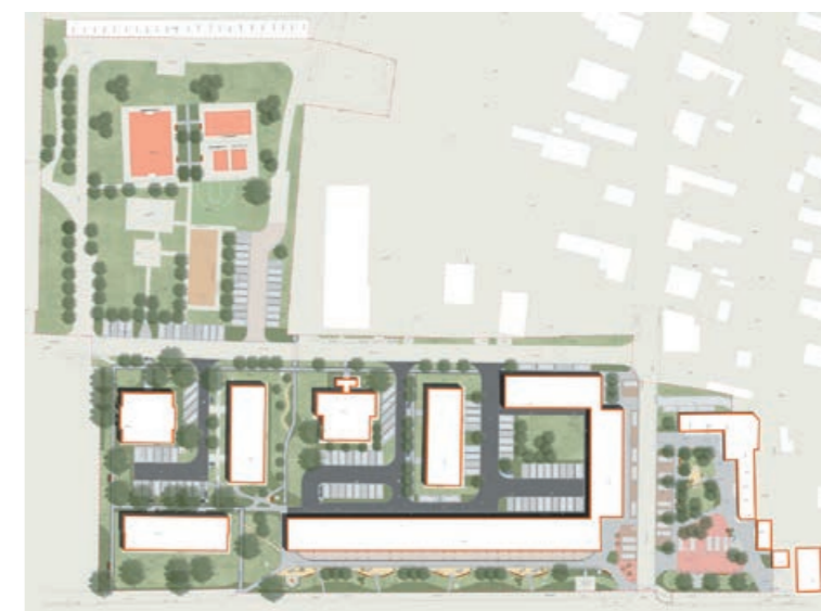
Madártávlatból így fest majd a Bercsényi tér és közvetlen környezete

nyezettudatos szemléletformáló hatást fejtenek ki, az okospad pedig információs és kommunikációs technológiák megismertetésére nyújt lehetőséget. A városban eddig teljesen hiányzó kulturális szolgáltatásként ide szabadterei kiállítótér létrehozását tervezik. A Semmelweis park terület északi végében található elhanyagolt salakos sportpálya és a kerítésének felújítása után a napelemes lámpákkal megvilágított területen kispályás futball, valamint asztalitenisz áll majd a sportolni vágyók rendelkezésére, amelyeket többsoros fásítások határolnak el a komor MÁV-tulajdonú területtől. A friss - egyelőre vizuális - városközpont el kell fogadnunk, szép lassan hozzá kell szoknunk, hogy aztán „belakva” majd meg is szerethessük.