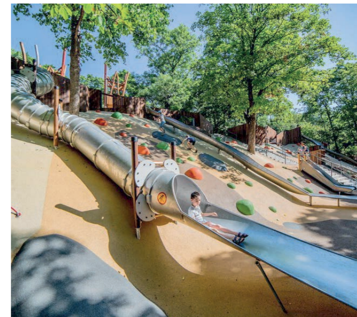
A csúszdapark lényege, hogy egymás mellett több, különböző hosszúságú és nehézségi fokozatú pályát használhatunk

című, TOP_PLUSZ-1.1.3-21-BO1-2022-00021 számon benyújtott pályázattal, amely a tervek szerint 400 millió forint vissza nem térítendő támogatásból valósulhat meg 2025. év végére. Eredményeként a már meglévő attrakciókra (szabadtéri színpad, kilátó, pincesorok) építve és azok kiegészítésével a dombtető a mára kedvelt helyi rendezvényter funkciója mellett az aktív turizmus, a családi szabadidős turizmus központi helyszínévé is válhat a közeljövőben. A város feletti új attrakív színterként megépül majd a meglévő fás domboldalhoz illeszkedő csúszdapark , a szabadtéri trambulinliget , valamint egy - kiegészítő jelleggel kisgyermek-játékoszkezköket is magába foglaló - sportliget . Használóik kényelmét szolgálják majd a telepített árnyékolók és a tájba illeszkedő utcabútorok. Természetesen a Pipiske liget sem áll meg a fejlesztésben, a jövőben a kilátó mellett zászlótartó oszlopok emelkednek, a terület pedig napelemes lámpákkal működő közüvilágítást kap. Rézsűpihenők (napozóágyak) és árnyékolók kihelyezésével új elemként megjelenik egy dombos tájba illő pihenőterület , a csúszdaparkkal szomszédos területre pedig egy családi liget , telepített ivókúttal. Környezeti nevelés céljából a korábbi tanösvény frissítésével és maivá formálásával létrejő-