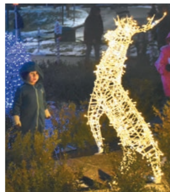
Sötétedés után az ünnepi fények ragyogták be a Generációk Kertjét