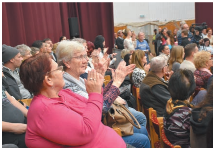
A közönség vastappsal honorálta a színvonalas produkciókat