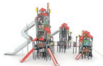
Valódi játszóvár épül majd a Generációk Kertjében

A most elnyert összegből szolgáltatásait - az elmúlt évek tapasztalatait felhasználva - tovább kívánják fejleszteni, és egyes korosztályokhoz, felhasználói körökhöz kapcsolódó, hiányzó funkciókkal bővíteni.