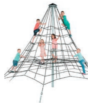
A korábbi, hagyományos (Harica utcai) játszótér területén a nagyméretű, kötélhálós mászókat is kipróbálhatják majd a gyerekek

Egy közösség gondolkodásáról sok mindent elmond, hogy a környezetének építésénél mennyire veszi figyelembe a gyerekek, a jövő generációja mai – de még jobb, ha a vélhető majdani – igényeit is. Mert minden ilyen értelmes építkezés egyben befektetés a jövőnkbe, és hasonló a diófához, amelyet sosem magunknak, hanem unokáinknak ültetünk. Tapasztalataim szerint a gyerekek önfeledt játék – nem a játszani engedés, hanem a velük együtt játszás - közben érzik fontosnak, szabadnak és boldognak magukat. Ha pedig ők boldogok, azzá varázsolják a körülöttük élő családtagokat is, amivel végül az egész közösség nyer. Talán hasonló megfontolások alapján épült az utóbbi években a városunkban is egyre több játszótér. A gyerekek öröme ezek nem egy kaptafára készültek,