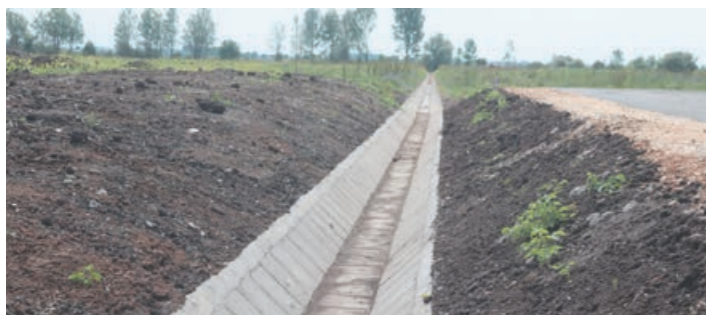
Az 547 m hosszú övárók a város délnyugati részét hivatott megvédeni

Számítások alapján Magyarországon az évszázad közepére minden évszak legalább 1 °C fokkal, a nyár átlagosan akár 4 °C fokkal is melegebb lehet. A növekvő párolgás, a gyorsuló felhőképződés miatt több és intenzívebb szélsőséges időjárás-változásra számíthatunk. Legfontosabb feladatunk tehát alkalmazkodni a fenti szélsőségekhez. A vízgazdálkodásban elsődleges szerepet kell kapnia a táj (talaj, gyepek, erdők) vízmegtartó képességének, hiszen már nemcsak a hírekben láttuk, hanem saját bőrünkön is tapasztalhattuk, hogy a szinte semmiből lesújtó villámárvizeknél még